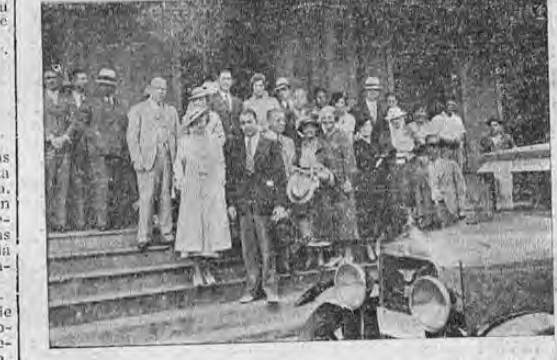
El grupo de 21 turistas en el momento de llegar a esta capital a la una de la tarde de ayer, posa para LA TRIBUNA