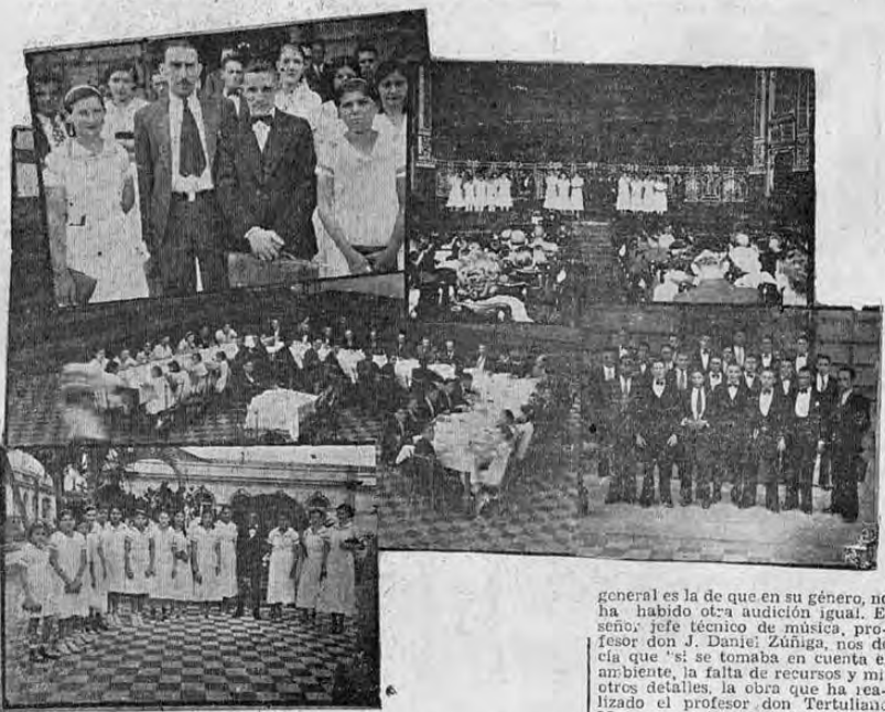
Indudablemente el progreso que el país está logrando en el divino ar...

(VIENE de la Página UNO) peraba le vitoreo y vitoreo al generalísimo, a Rusia soviética y a la república proletaria, dando los consiguientes votos al capitalismo. Algunos observadores han dicho que el fiscal anterior pudo presentar suficientes pruebas para procesar y condenar a treinta años de prisión a siete separatistas catalanes, mientras el nuevo fiscal, que tomó posesión de su cargo diez días antes de iniciarse el proceso contra Largo Caballero, no ha sido capaz de probar cargo alguno contra un solo acusado. Algunos conservadores piensan que es a inoportunidad del fiscal perjudicará a la larga al conservatismo español, porque Largo Caballero es un político infuyente y un ardiente socialista. Fue ministro del trabajo y actualmente diputado a cortes, presidente del comité ejecutivo del partido socialista y secretario del sindicato general de trabajadores, y un orador elocuentísimo.